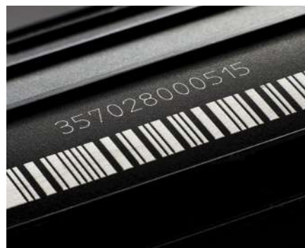
Marcaje contrastado en plásticos