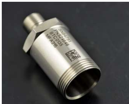
Recocido o cambio de color