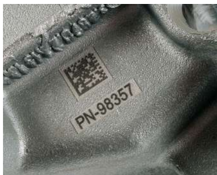
Limpieza de la superficie