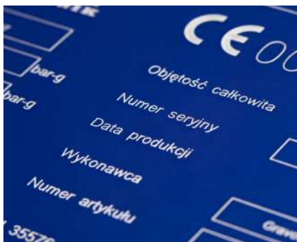
Retirada de recubrimiento