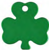
MEDALLA I - TRÉBOL