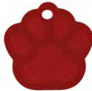
MEDALLA C - HUELLA GRANDE