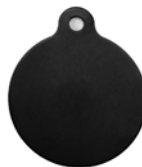
MEDALLA G - CÍRCULO PEQUEÑO