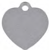
MEDALLA E - CORAZÓN GRANDE