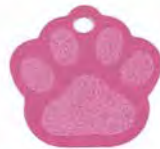
MEDALLA D - HUELLA PEQUEÑA