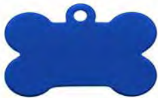
MEDALLA A - HUESO GRANDE