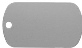
MEDALLA H - CHAPA MILITAR