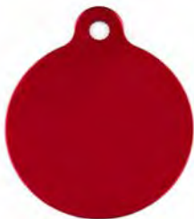
MEDALLA J - CÍRCULO GRANDE