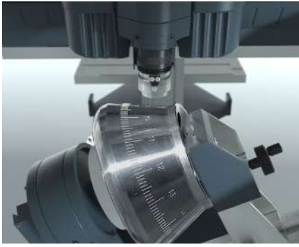
Marcado de piezas mecánicas e industriales: marcado directo de piezas