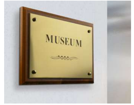
Placas profesionales e institucionales