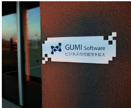
Exhibiciones POP y grabado de letreros