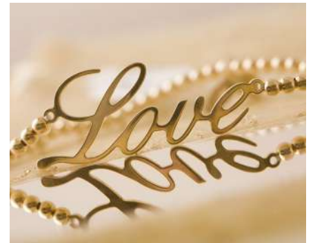
Corte fino de metales