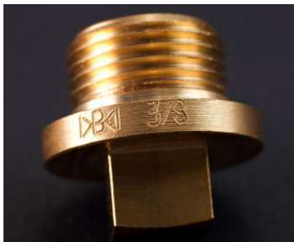
Todo tipo de piezas pequeñas