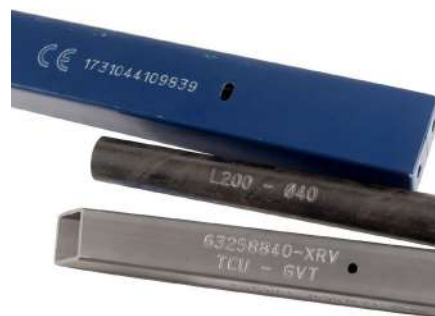
Materiales pintados, revestidos o en bruto