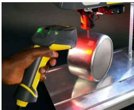
Escáner de mano o de posición fija para la lectura o comprobación de códigos