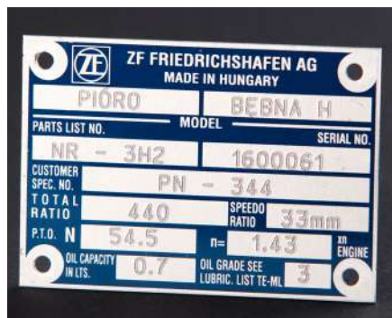
Placas de identificación