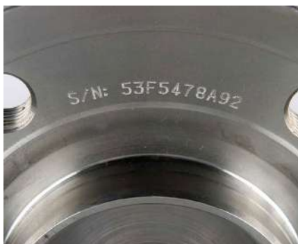
Piezas para automoción