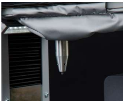
Fuelle de protección (opcional)