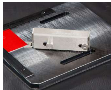
Placa de posicionamiento insonorizada con abrazadera magnética de liberación rápida