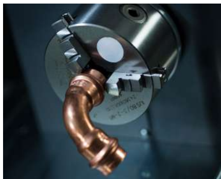
Accesorio rotativo para marcado de piezas cilíndricas