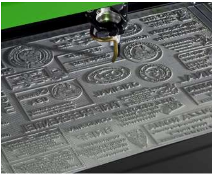
Grabado y corte por láser de sellos de caucho personalizados