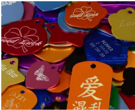
Grabado de medallas y chapas de mascotas