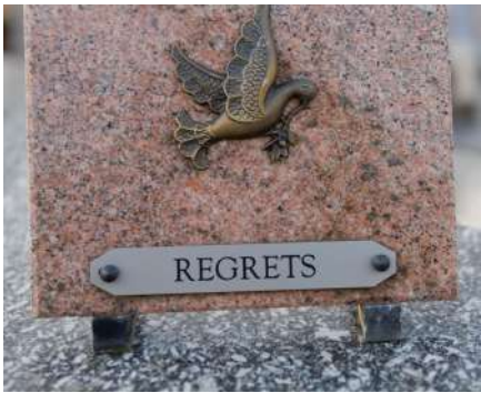
Gravado de placas funerarias y lápidas