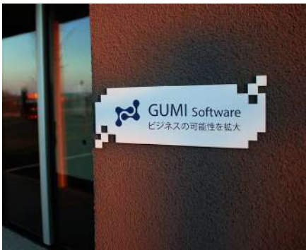
Expositores PLV y grabado de rótulos