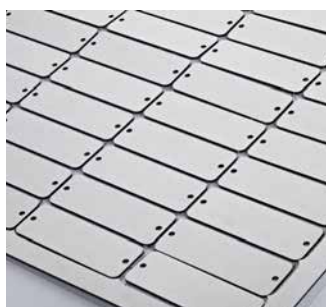
Pequeñas etiquetas y placas